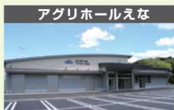
アグリホールえな