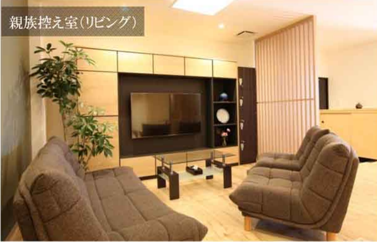
親族控え室(リビング)

ご親族控室はリビングだけでなく、和室のスペースもご用意し、ご家族・ご親族がゆっくりとくつろぐことのできる空間をご提供いたします。