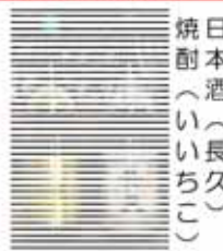
ご主人のおすすめ！