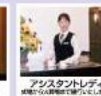
アシスタントレディ お葬儀から送迎まで行います。