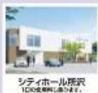
シティホール所沢 100名収容の広さです。