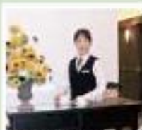
アシスタントレディ お葬儀から送迎まで行います。