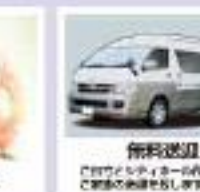
無料送迎 お葬儀から送迎まで行います。