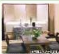
シティホール所沢 告別ルーム