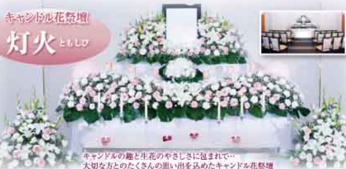
キャンドルの趣と生花のやさしさに包まれて… 大切な方とのたくさんの思い出を込めたキャンドル花祭壇