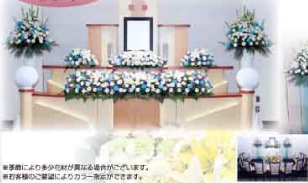
※季節により多少花材が異なる場合がございます。 ※お客様の要望によりカラー指定ができます。

昔にとられることなく、 シティホール羅沢に合った 上質な空間を演出するプレジャー祭壇