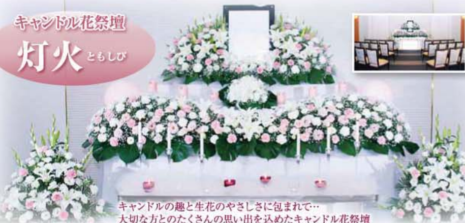
キャンドルの趣と生花のやさしさに包まれて… 大切な方とのたくさんの思い出を込めたキャンドル花祭壇