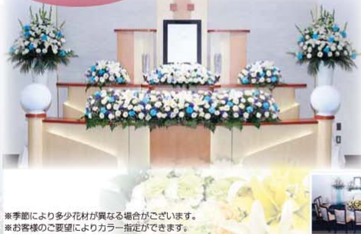
※季節により多少花材が異なる場合がございます。 ※お客様のご要望によりカラー指定ができます。

昔にとらわれることなく、 シティホール藤沢に合った 上質な空間を演出するプレジャー祭壇